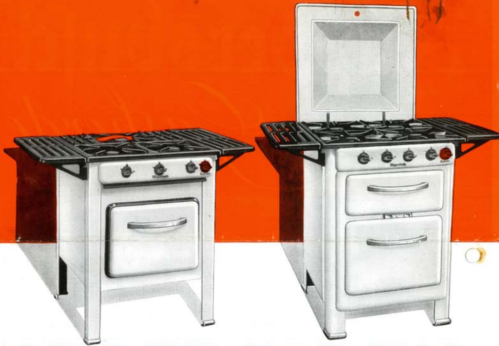
Gasherde Nr. 8503/3, 8503/4 u. 8505/3, 8505/4

8503/3 u. 8503/4 (3 u. 4 Flammen): Bratofentürrahmen schwarz emailliert - 8505/3 u. 8505/4 (3 u. 4 Flammen): Bratofentürrahmen verchromt.