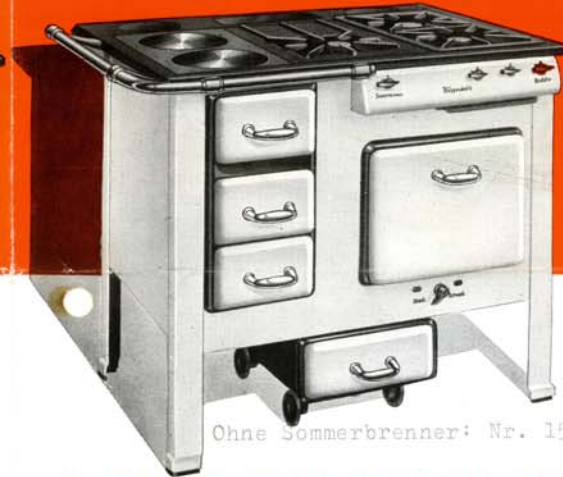
Ohne Sommerbrenner: Nr. 1522/2