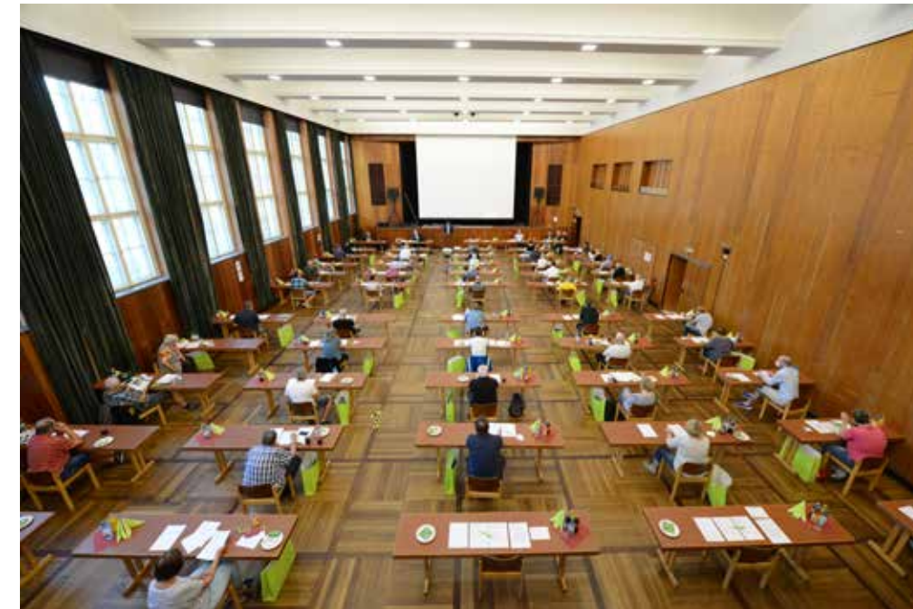
Ein Blick auf die Vertreterversammlung 2021 in der Stadthalle Schweinfurt